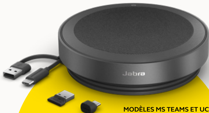
MODÈLES MS TEAMS ET UC

Pour apporter notre contribution à la protection de l'environnement, nous veillons à réduire notre empreinte écologique à chaque étape de la fabrication de nos produits. Le revêtement du Speak2 75 est composé de plus de 33 % de matériaux durables 3 et d'un nombre important de pièces réparables ou remplaçables. Voilà l'équation magique : préservation de l'environnement = durée de vie prolongée = qualité d'appels supérieure sur la durée, pour vous et votre équipe.